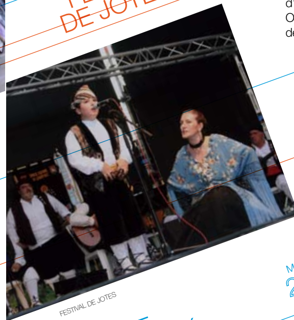
FESTIVAL DE JOTES