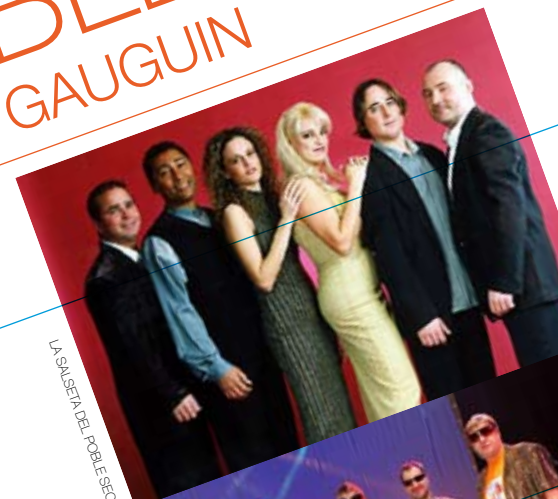
LA SALSETA DEL POBLE SEC

I per postres, El Frenillo de Gauguin. Música de ball "kutreligera" que va marcar les dècades dels 60 i 70, interpretades a ritme de segle XXI. Que continuï la festa!