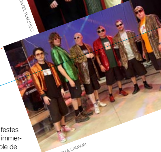
EL FRENILLO DE GAUGUIN