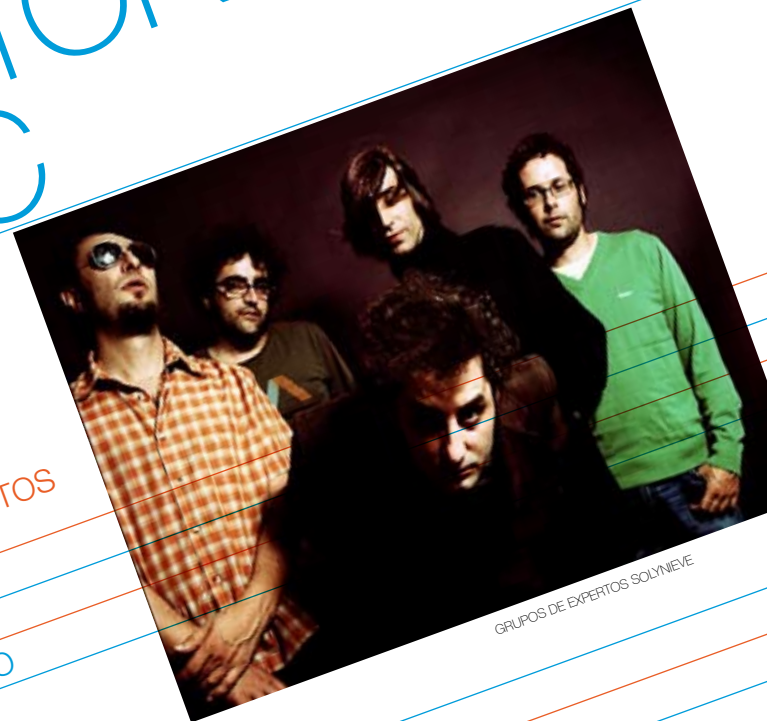
GRUPOS DE EXPERTOS SOLYNIEVE

Escenari Sintonitza FM GRUPO DE EXPERTOS SOLYNIEVE SR. CHINARRO BIG CITY GUISANTE MÁGICO